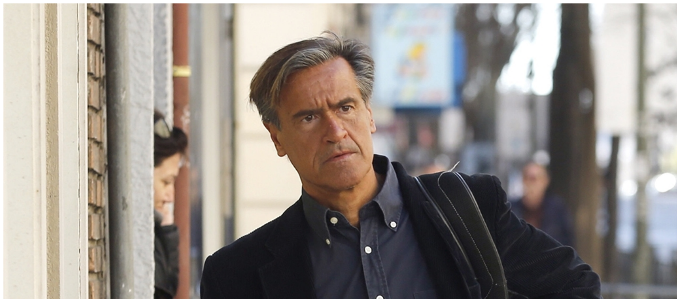
El eurodiputado socialista canario, Juan Fernando López Aguilar