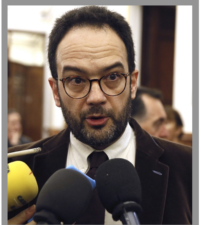
Antonio Hernando

Antonio Hernando ha expresado la profunda tristeza de los socialistas por el fallecimiento del ex ministro y ex portavoz del Grupo Parlamentario Socialista, José Antonio Alonso, fallecido en la madrugada de ayer, y ha trasladado sus condolencias a sus familiares y amigos. El Pleno del Congreso comenzó guardando un minuto de silencio. "Fue un gran jurista... [LEER MÁS]