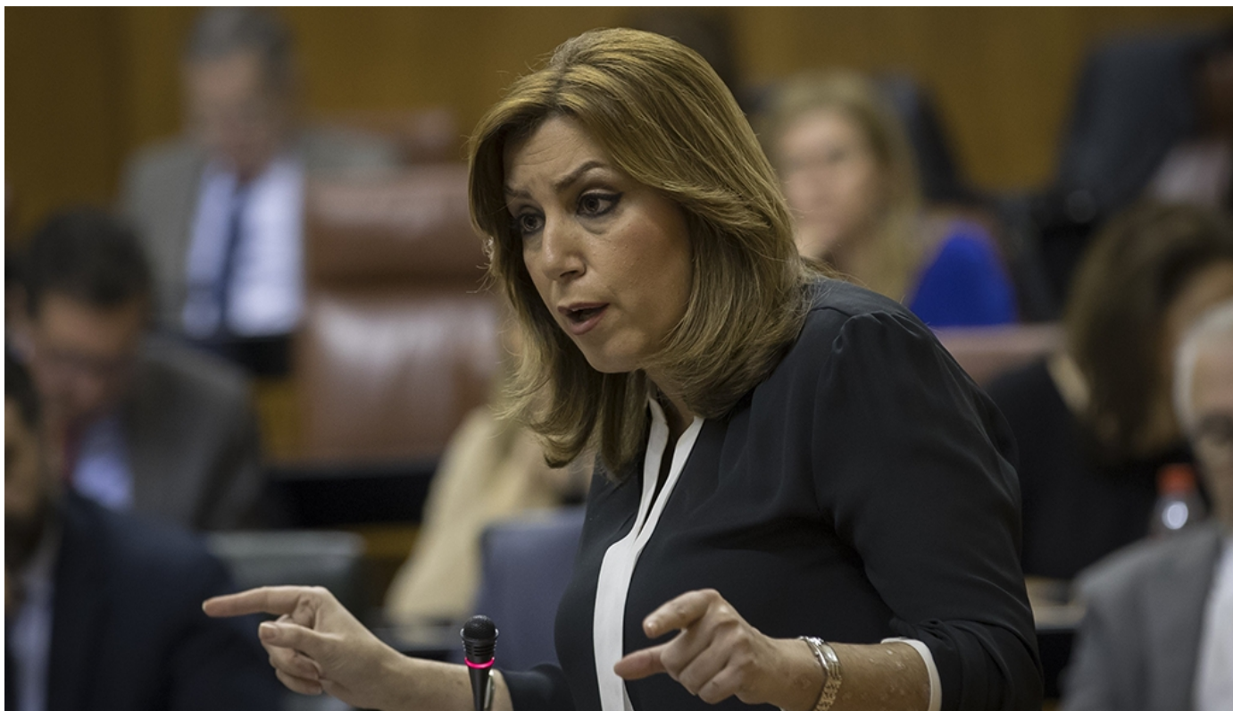
La presidenta andaluza, Susana Díaz

La presidenta de la Junta, Susana Díaz, ha desvelado que Andalucía ha cumplido en 2016, por cuarto año consecutivo, el objetivo de déficit, con un 0,68% al término del ejercicio y un nivel de endeudamiento 2,7 puntos por debajo de la media, y que al mismo tiempo ha respondido a su compromiso "con las personas", manteniendo los servicios públicos.