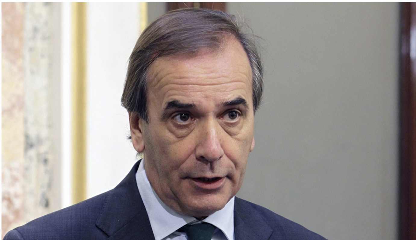
Fotografía de archivo del 28 de junio de 2011 de Jose Antonio Alonso, exministro de Interior y de Defensa en los gobiernos de José Luis Rodríguez Zapatero