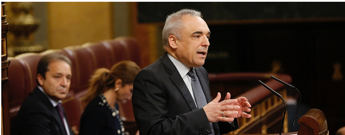
El portavoz de Empleo en el Congreso, Rafael Simancas