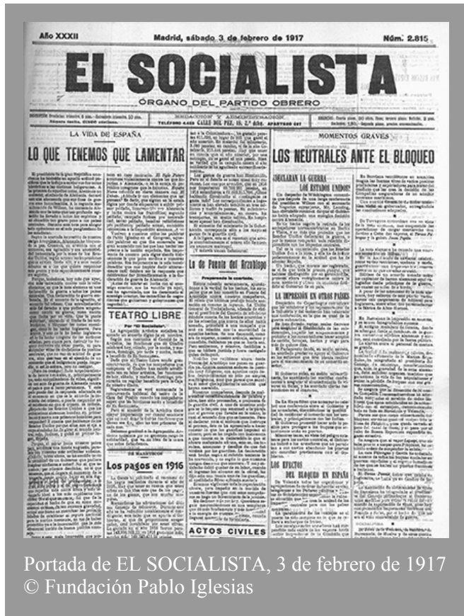
Portada de EL SOCIALISTA, 3 de febrero de 1917