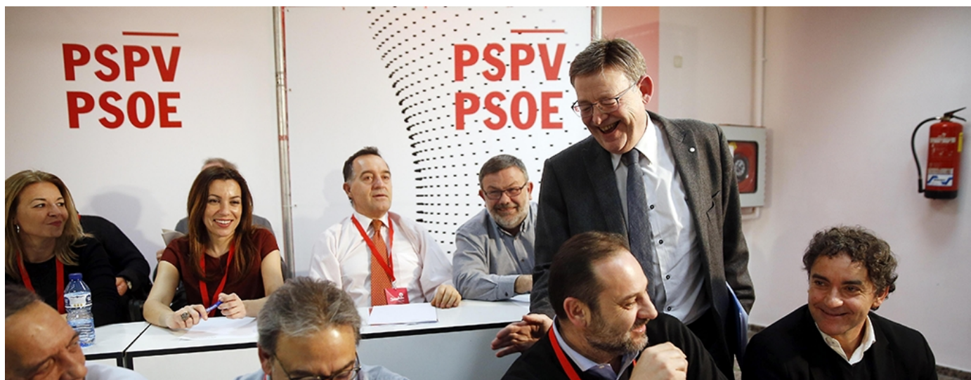
El secretario general del PSPV-PSOE y presidente de la Generalitat, Ximo Puig (2d)