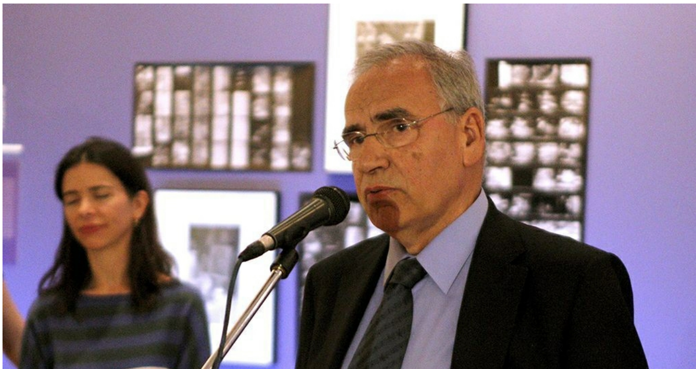
Alfonso Guerra en la inauguración de la exposición "La maleta mexicana", 2012