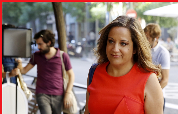
La portavoz socialista de la comisión de Derechos de la Mujer e Igualdad de Género, Iratxe García

"El Parlamento Europeo tiene que servir de altavoz para denunciar la mutilación genital femenina, una tortura para las mujeres que supone una auténtica violación de los derechos humanos", ha denunciado la portavoz socialista de la comisión de Derechos de la Mujer e Igualdad de Género, Iratxe García. Durante su intervención en el debate Tolerancia cero frente a la mutilación