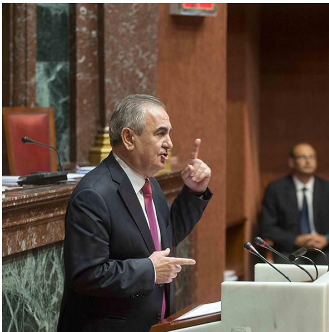
Rafael González Tovar / EFE